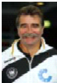
Heiner Brand DHB Bundestrainer